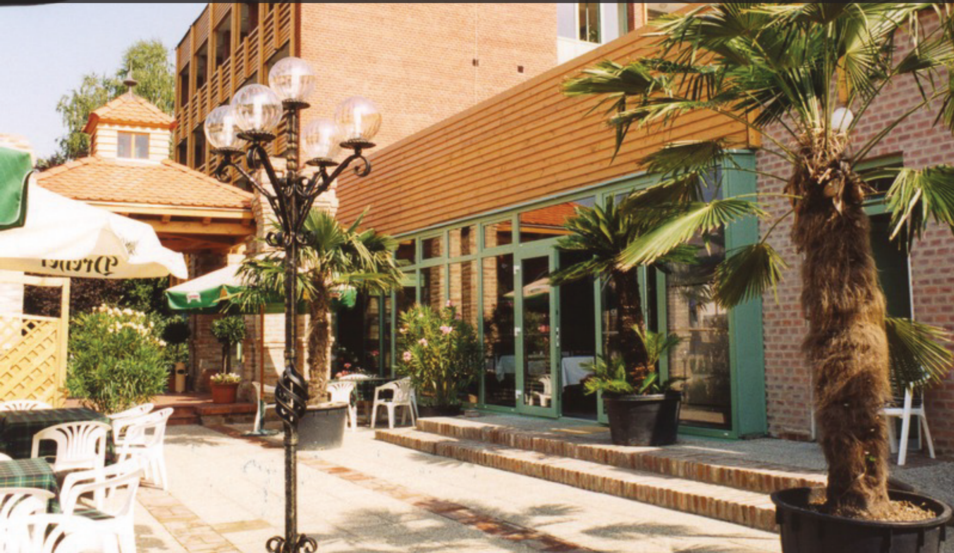
Thermal Hotel★★★★ Harkány

A hóforrásáról jól ismert településen Harkányban a négycsillagossá előlépett Thermal Hotelben 131 szoba várja a vendégeket. A szállodai és éttermi funkción túl gyógyászati szolgáltatások is rendelkezésre állnak. Az itt immár egy évtizede működő integrált szállodai rendszer front office, vendéglátás, áruforgalom és gyógyászati szoftvereket foglal magában.